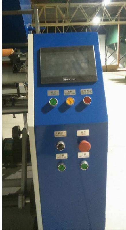
3. fotó: Automata stretch film újratekerceselő