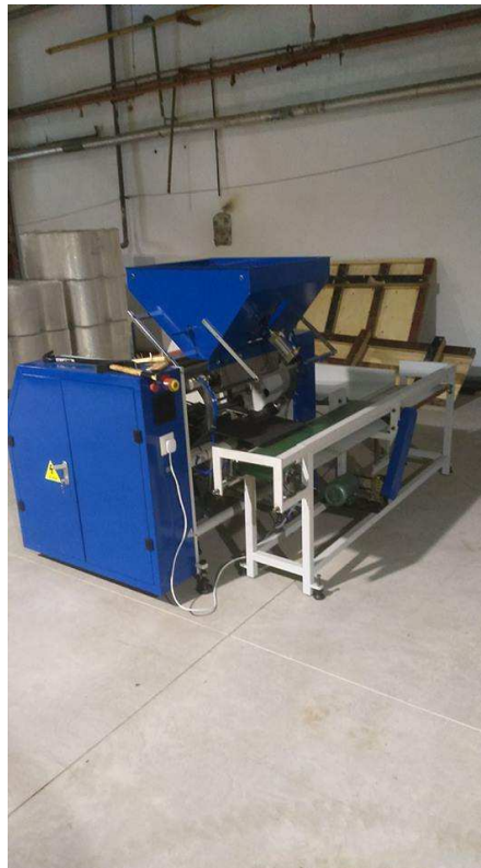
5. fotó: Automata stretch film újratekerceselő