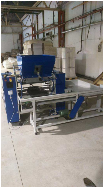
2. fotó: Automata stretch film újratekerceselő