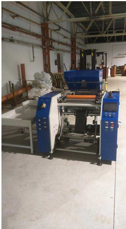
1. fotó: Automata stretch film újratekerceselő