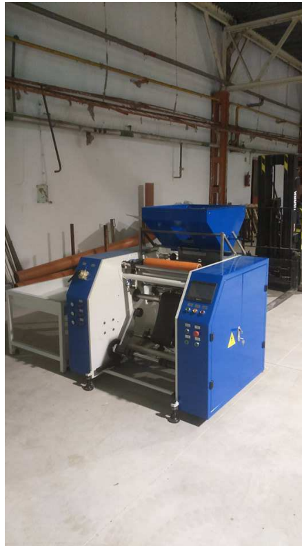
4. fotó: Automata stretch film újratekerceselő